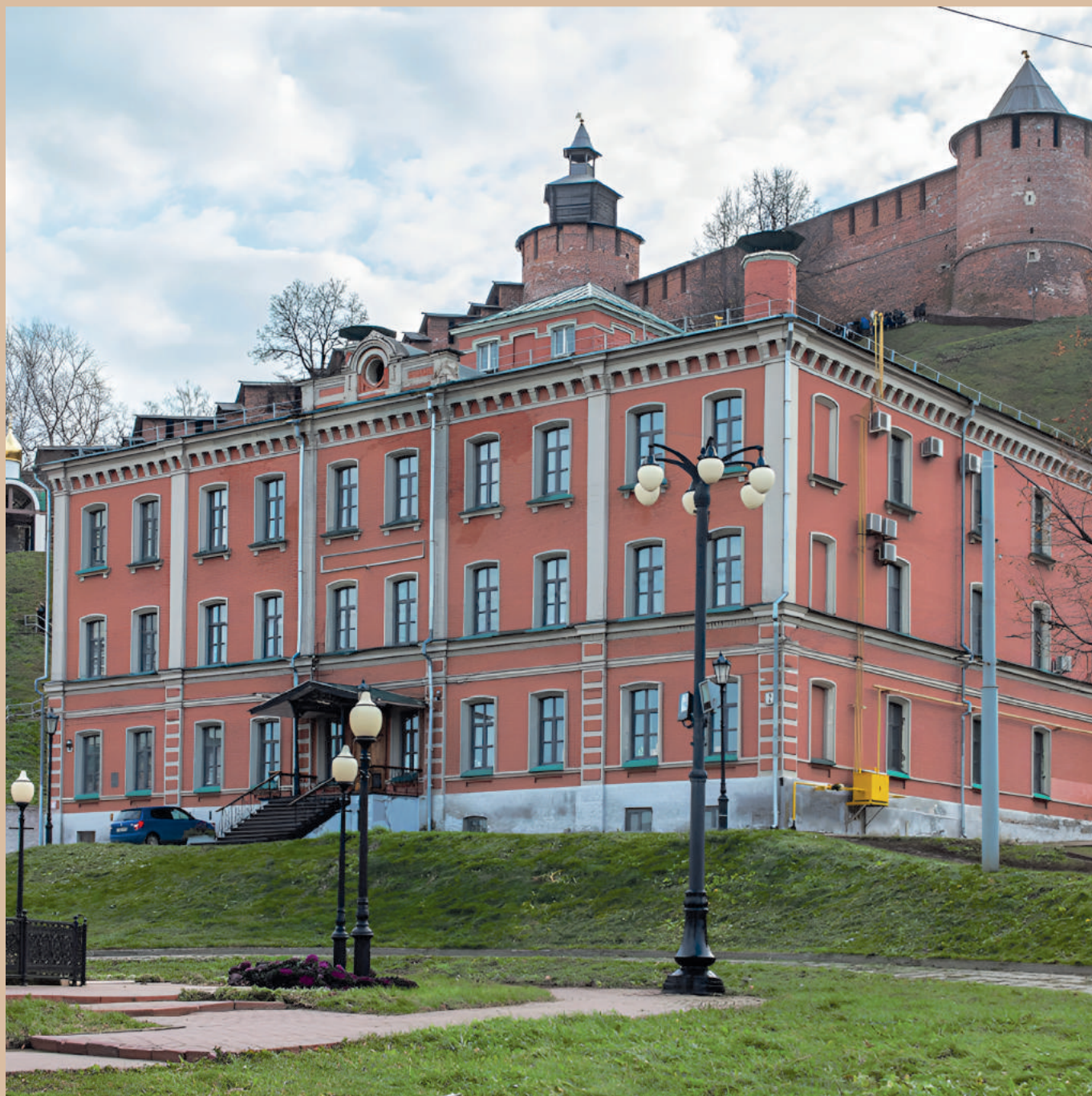
Ночлежный дом Бугровых ул. Рождественская, 2