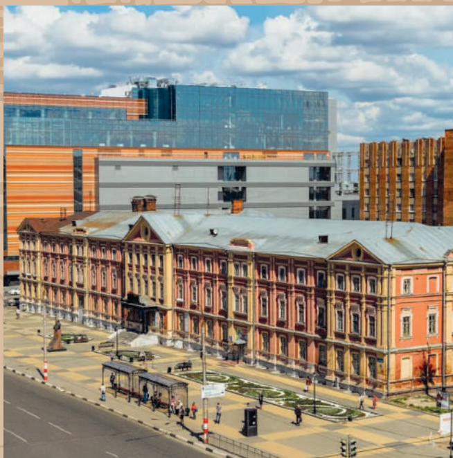
Вдовый дом площадь Лядова, 2