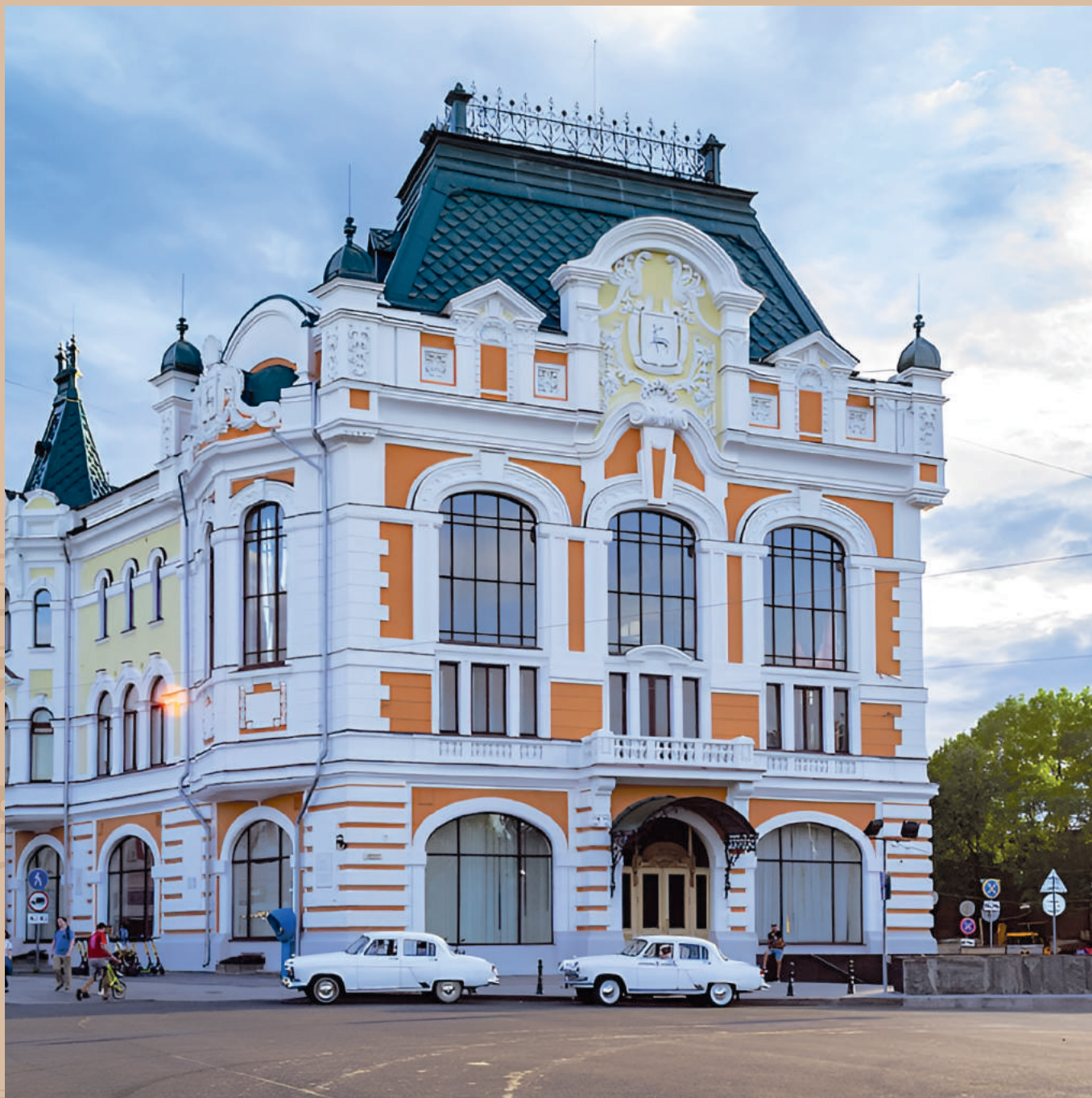
Здание городской Думы ул. Большая Покровская, 1